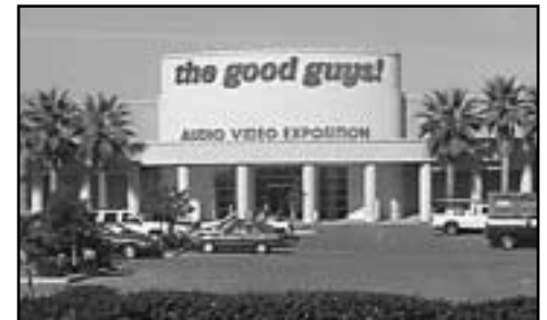
Ravenswood 101 Retail Center

mum of $1 million in annual sales tax revenue to East Palo Alto and anticipates 550 new jobs. A portion of Phase 4 may contain a mixed-use office/retail development with the developer agreeing to set aside below market rate retail space reserved for local retailers, a first in East Palo Alto.