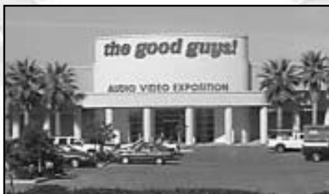
Ravenswood 101 Retail Center

Reurbanización es una herramienta creativa para atraer inversiones privadas a EPA. En solo tres años, a aumentado el presupuesto de la ciudad para mantener las calles, los albañales, escuelas y